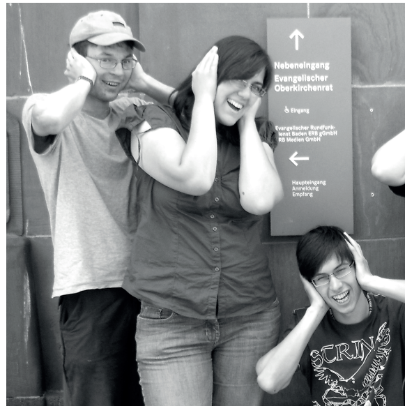
ein Teil des Teams nach den Interviews für BigFM